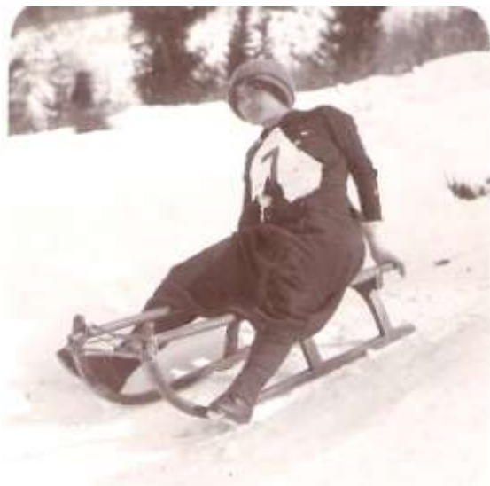
Tekmovalka na saneh, Sankališče Lancovo, pred 1914