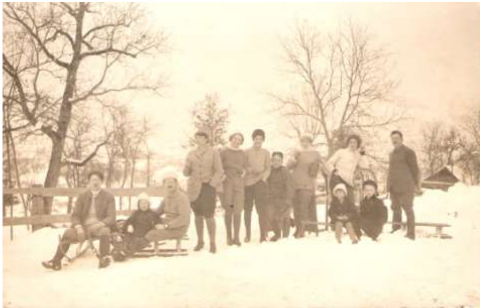
Sankači na Lancovem (po spustu), pred 1914