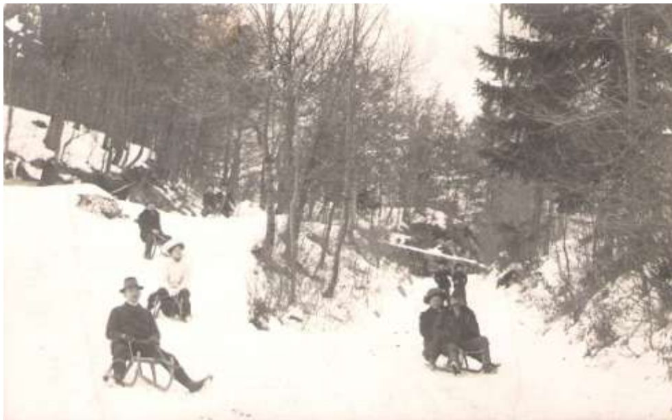
Sankanje s Pustega gradu, pred 1914